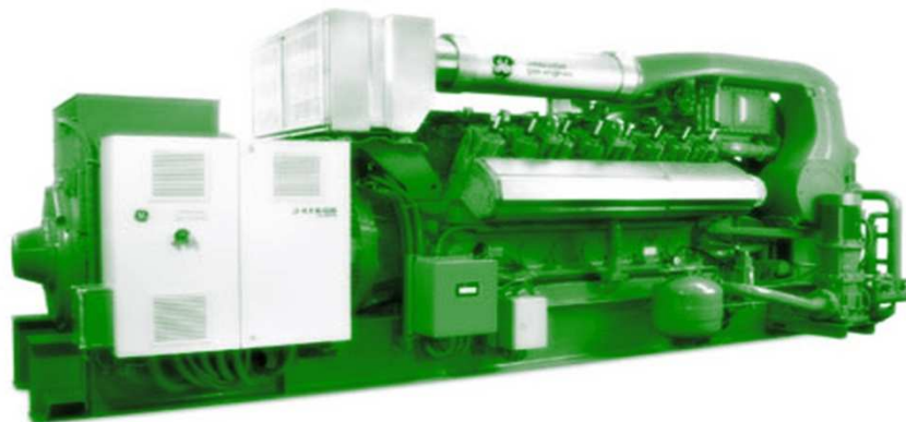
Рис.: Символическое изображение, может отличаться от описанного модуля