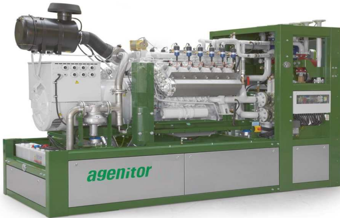
Рис.: Символическое изображение, может отличаться от описанного модуля

Готовая к подключению компактная блочная тепло-электроцентраль состоит в основном из следующих узлов: