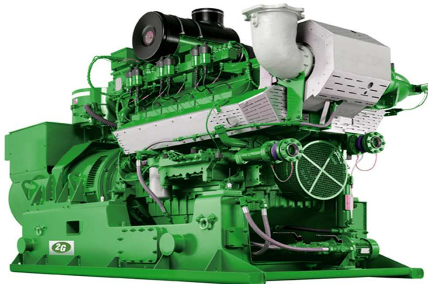
Рис.: Символическое изображение, может отличаться от описанного модуля

Готовая к подключению компактная блочная теплоэлектроцентральный в основном состоит из следующих узлов: